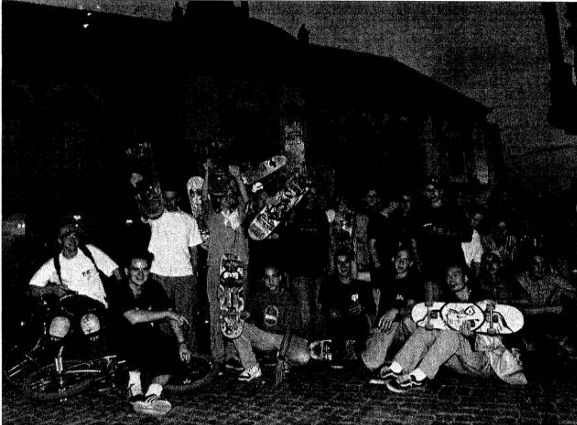
Jugendliche aus der ganzen Stadt demonstrierten am Sonnabend vor dem Rathaus für einen Bike- und Skate-Park.